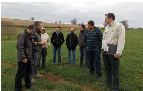
Formation "Coût de production en lait Bio" - Bongheat 2015

• Gagner en autonomie protéique pour améliorer la rentabilité de son exploitation en agriculture biologique 27 mars et 24 avril 2018 | Pontamur