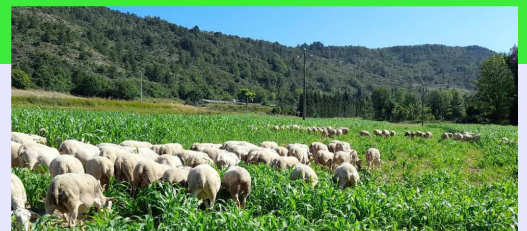
photo ci-contre, double culture méteil pâture puis sorgho pâturé, expérimentation SécuFourrages dans la Gervanne